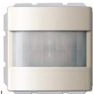
Датчик движения Комфорт