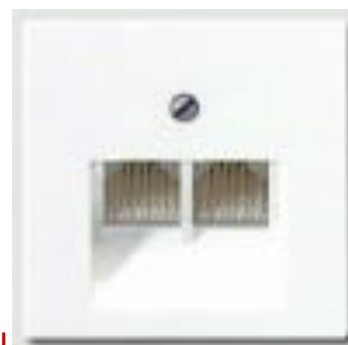
Розетка ком 5кат 2-я