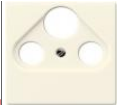
Механизм спутниковой антенной розетки прох,210 BM210+A561PLTV