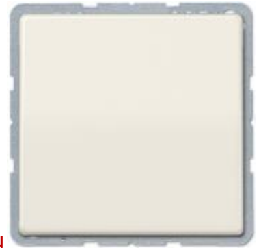
Кабельный вывод AS590