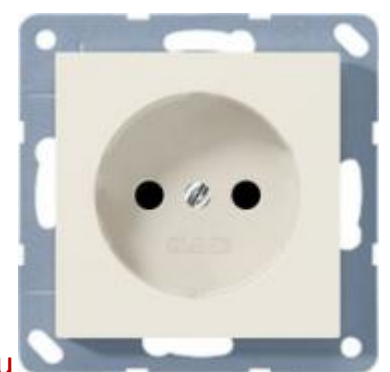
Штепсельная розетка A1520