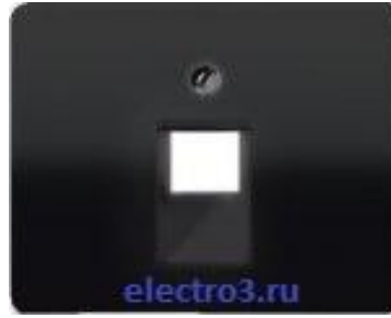
Розетка компьютерная 5кат 1-я UAE-1-0+SL569-1UASW