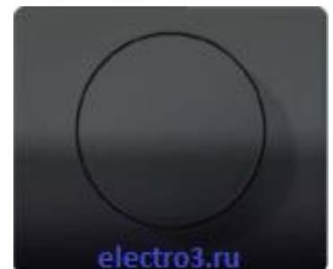
Регулятор частоты вращения