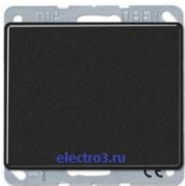
1кл выкл.с индикацией 501u+90+ SL590KO5SW