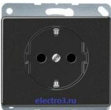
Штепсельная розетка SCHUKO 16A 250V~ SL520SW