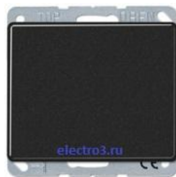
1кл перекрестный 507u+ SL590SW