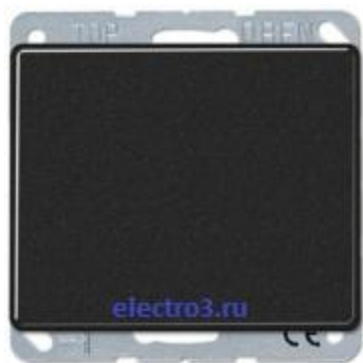
1кл выкл. кнопочный 531u+ SL590SW