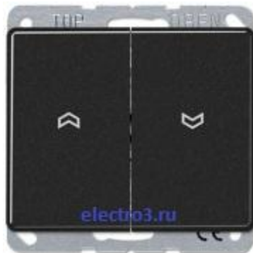
Механизм жалюзи с блокировкой и без блокировки