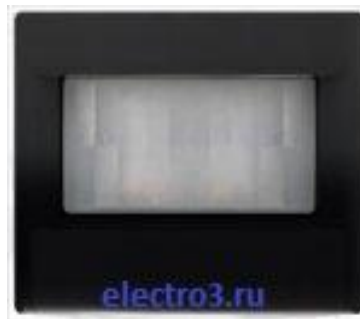
Датчик движения Комфорт ASSL1280-1SW