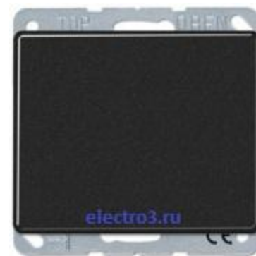
1кл прох.с индикацией 506u+90+ SL590KO5SW