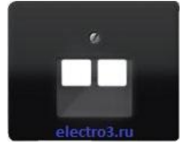
Розетка компьютерная 5кат 2-я UAE-2-0+ SL569-2UASW