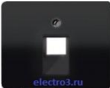
Механизм телефонный 1-й 13010404+ SL569-1UASW