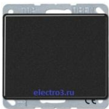
1кл переключатель 506u+SL590SW