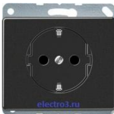
Штепсельная розетка с защитой от детей; SL520SWKL